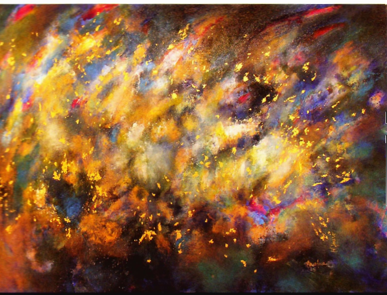
LA NUEVA FRONTERA

Acrílico, pigmentos y hoja de oro sobre lienzo 120 x 180 cm.