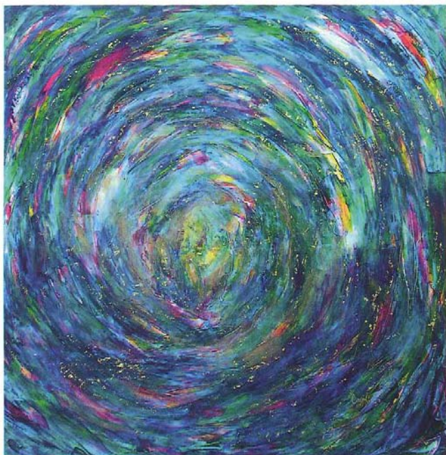
HERRAMIENTAS PARA SEMBRAR Acrílico, pigmentos y hoja de oro 23 k sobre lienzo 100 x 100 cm