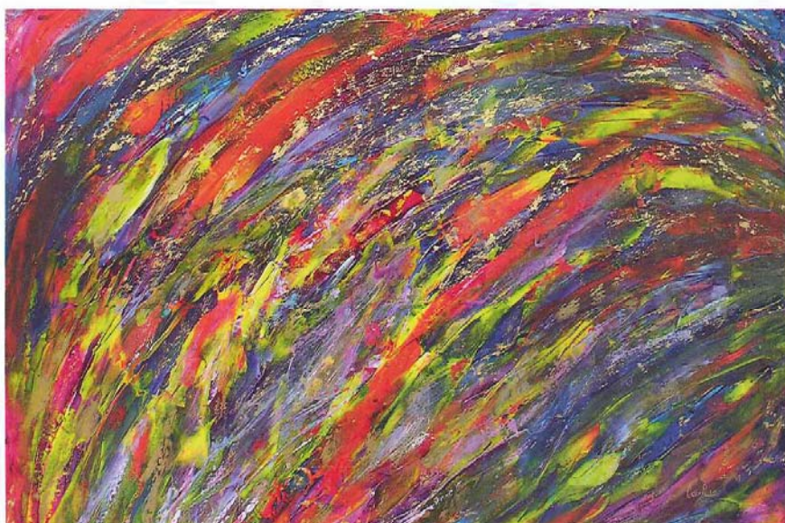
ESCUELAS CAMPESINAS Acrílico, pigmentos y hoja de oro 23k sobre lienzo 80 X 100 cm