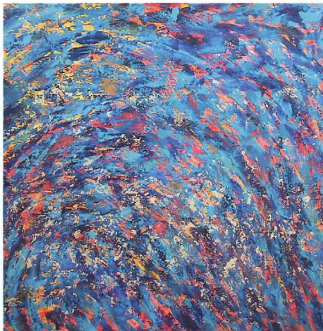
CONSEGUIR Acrílico, pigmentos y hoja de oro 23 k sobre lienzo 100 x 110 cm